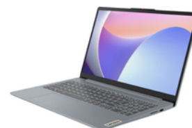
C. Notebook / Computador