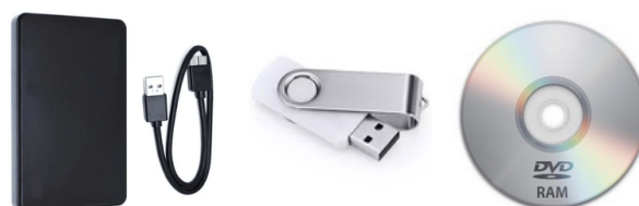
H. Armazenamento dos filmes HD externo / Pendrive / dvd

Todos os equipamentos listados podem ser substituídos por outros que façam a mesma função e estejam disponíveis dentro da realidade de cada cineclube.