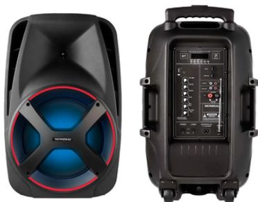
A. Caixa de som