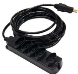
G. EXTENSÕES / FILTRO DE LINHA